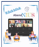
Bei den „AbendNIUS“ diskutierten 12 Teilnehmer*innen aktiv mit.