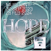
Ankündigung der Ausstellung „Hope“ im Museion

Ausschuss hat OKAY für das Simultandolmetschen im Rahmen seiner öffentlichen Sitzung am 5. Oktober 2023 sowie der Tagung „Partizipation und Teilhabe von Kindern und Jugendlichen mit Behinderungen in Südtirol“ engagiert.