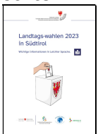
Titelbild der Landtagswahlenbroschüre 2023

- Die Sozialgenossenschaft Südtiroler Kinderdorf hat für ein gemeinsames Projekt des nördlichen und südlichen Wipptales bei OKAY Texte für Eltern in die Einfache Sprache übertragen lassen. Inga Kramer, Illustratorin für Leichte Bilder, hat für die 40 pädagogischen Impulse Leichte Bilder erstellt, die möglichst inklusiv die besprochenen Themen wiedergeben sollten.