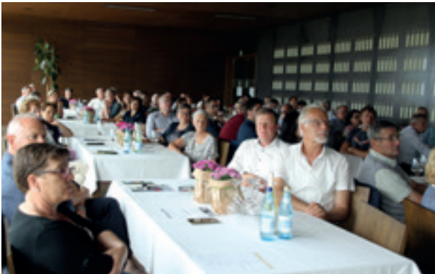
Mitgliederversammlung mit Jahresrückblick 2022

Den Vorsitz der Mitgliederversammlung führt der Obmann des Vorstandes, im Falle einer Verhinderung seine Stellvertreterin. Sollten beide verhindert sein, führt das älteste Mitglied den Vorstand.