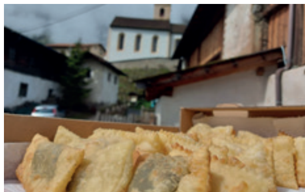
Spendenaktionen wurden zu verschiedene Ursache Notsituation.JPG denen Anlässen organisiert.

Alle gemeinsam verfolgen ein Ziel: Not dort zu lindern, wo sie auftritt.