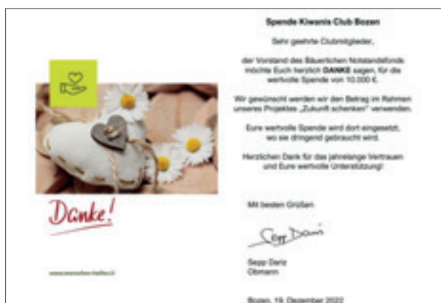
Dankeskarte für die Spender

Den großzügigen Spendern und Gönnern wurde mit einer Dankes- und einer Weihnachtskarte für das Vertrauen gedankt.